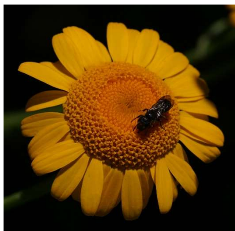
Löcherbiene auf Färberkamille