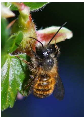
Rostrote Mauerbiene auf Stachelbeere